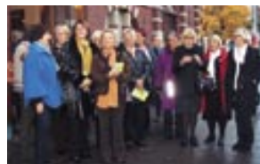
↑ BPW Sweden puheenjohtajapäivien osallistujia Turussa ravintola Koulun edessä.