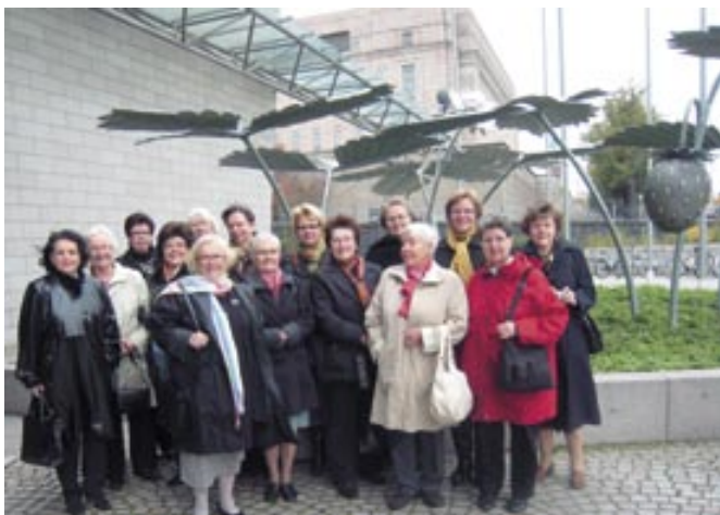
↑ Turkulaisia liike- ja virkanaisia Pikkuparlamentin edustalla.

Terveisinä kaikille Suomen liike- ja virkanaisille ystävämme esittivät kutsun ottaa yhteyttä paikallisyhdistyksiin ja tavata heitä milloin vain liikumme Ruotsissa paikkakunnilla, joissa liike- ja virkanaisilla on toimintaa! Yhteystiedot löytyvät internetistä www.bpw-sweden.org à Klubbar à