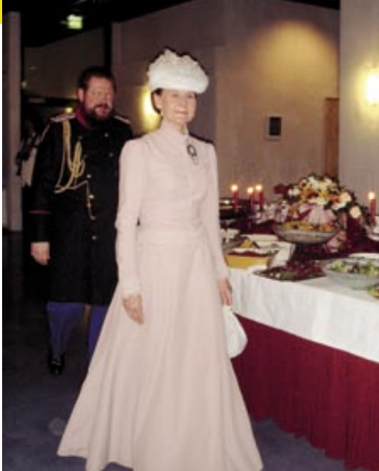
Yllätysvieras keisarinna Maria Fjodorovna adjutantteineen.