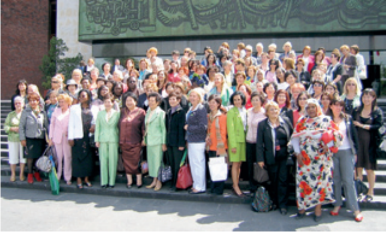
† Kutsuvieraat Meksikon parlamentin portaita v. 2008 Mexican Cityn kongressissa.