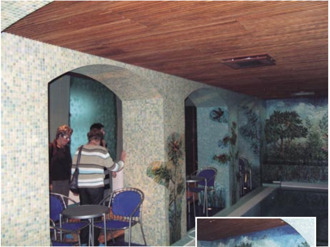
Sauna- ja allasosastolla on tamperelaisen taiteilija Tuula Lehtisen suuri lasimosaiikkityö ”Leilan puutarha”.