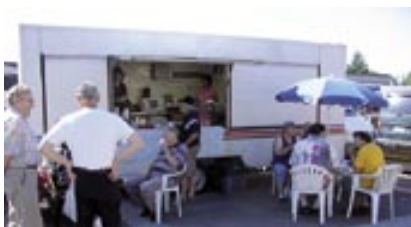
Torikahvilamme Kausalan markkinoilla 7.8.2007.