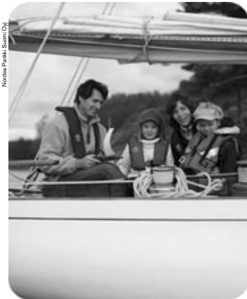
Nordea Pankki Suomi Oyj