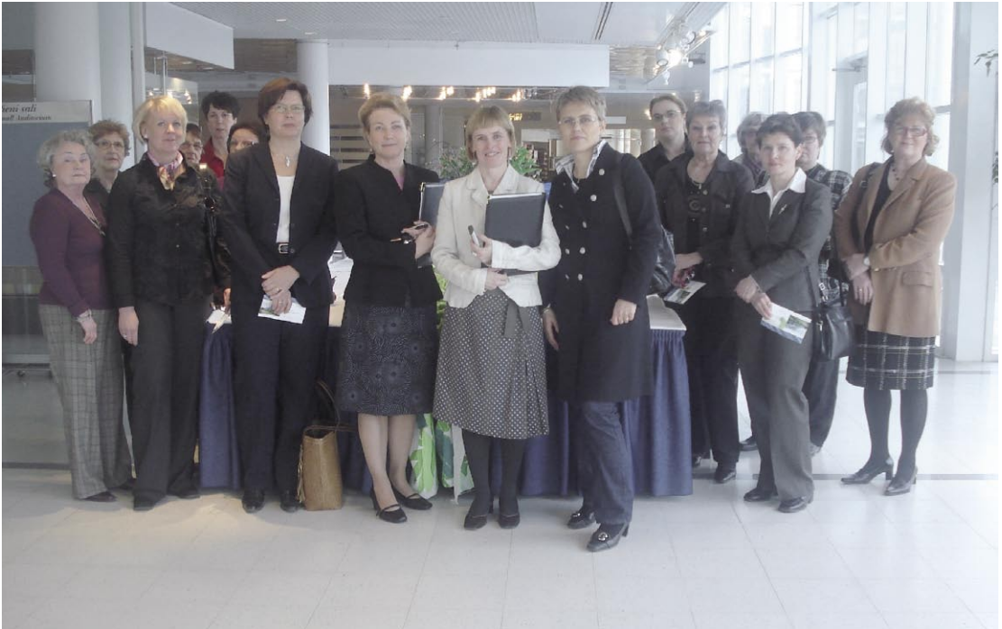
Tampereen liike- ja virkanaiset kävivät tutustumassa Tampere-talon kongressi- ja kokoustiloihin. Samalla saatiin tietoa Tampere-talon monipuolisesta ohjelma- ja tapahtumatarjonnasta.