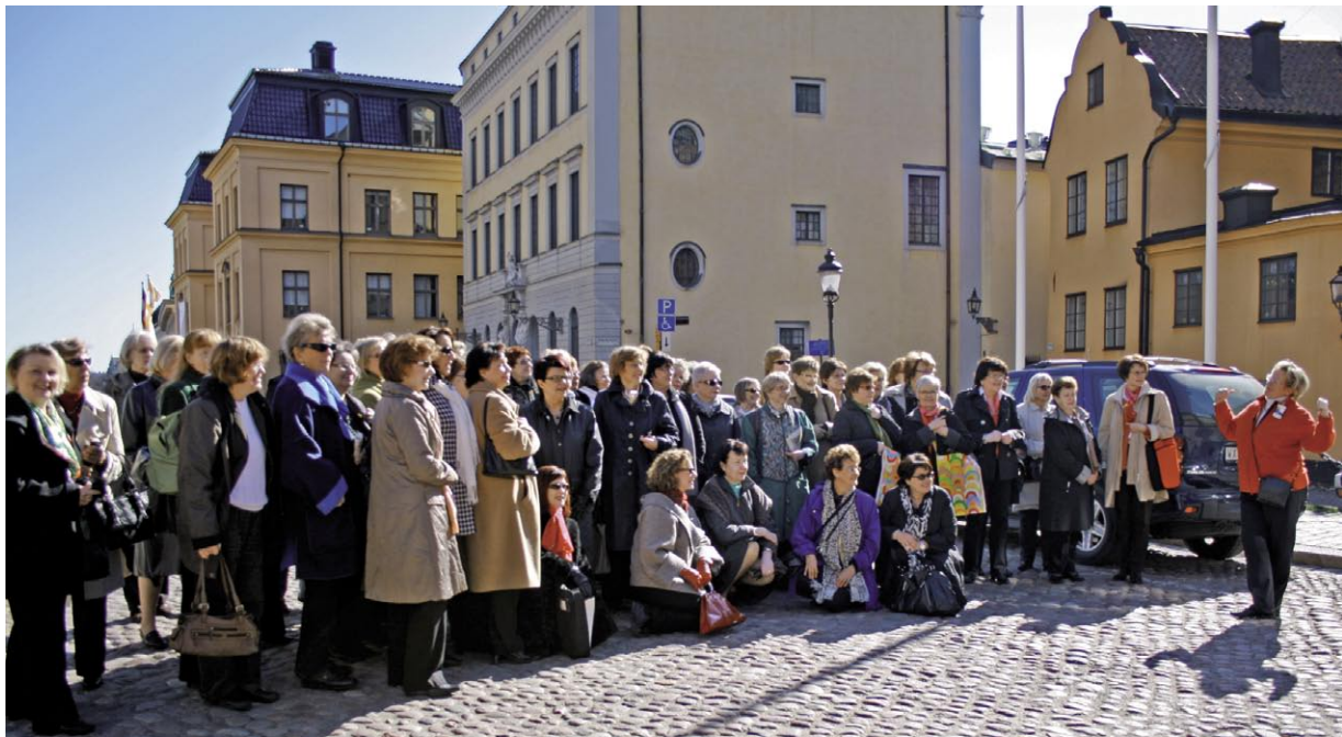
1 Liike- ja virkanaiset kuuntelemassa opasta Tukholman suomalaisen kirkon edessä.

Meille kevätkokoukseen osanottaville riitti kuitenkin pääasiallisena liikkumasäteenä Vanha kaupunki. Kokouspaikkamme naapuristossa sijaitti lounasravintolamme Myntkrogen museoineen sekä vieraittemme hotelli